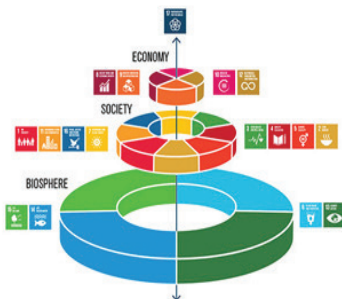
Slika 5. Novi pogled na dimenzije i ciljeve održivog razvoja

Već pomenute dimenzije održivog razvoja: ekonomska, socijalna i ekološka, nisu neovisne i već ustaljeni način prikazivanja SDG kao na slici 1 može dati pogrešan utisak da su ciljevi neovisni i da ne utiču jedni na druge. Za zaključak ovog izlaganja daje se novi pogled na SDG 2030 koji je kreiran u Stockholm Resilience Centru. Ovaj novi pogled dat na slici 5 integriše globalne ciljeve zajedno i vješto postavlja biosferu za temelj globalne održivosti, povezujući svih 17 ciljeva i sve tri dimenzije i ističući kako je hrana povezana sa svakim od globalnih ciljeva.