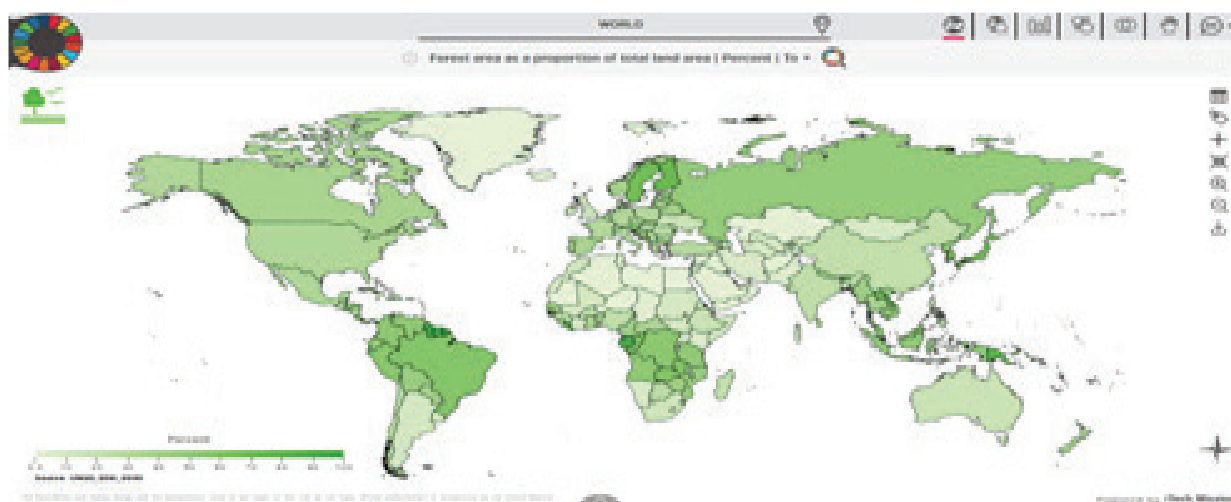
Slika 4. Primjer iz aplikacije "SDGs Data Dashboard" za indikator 15.1.1.