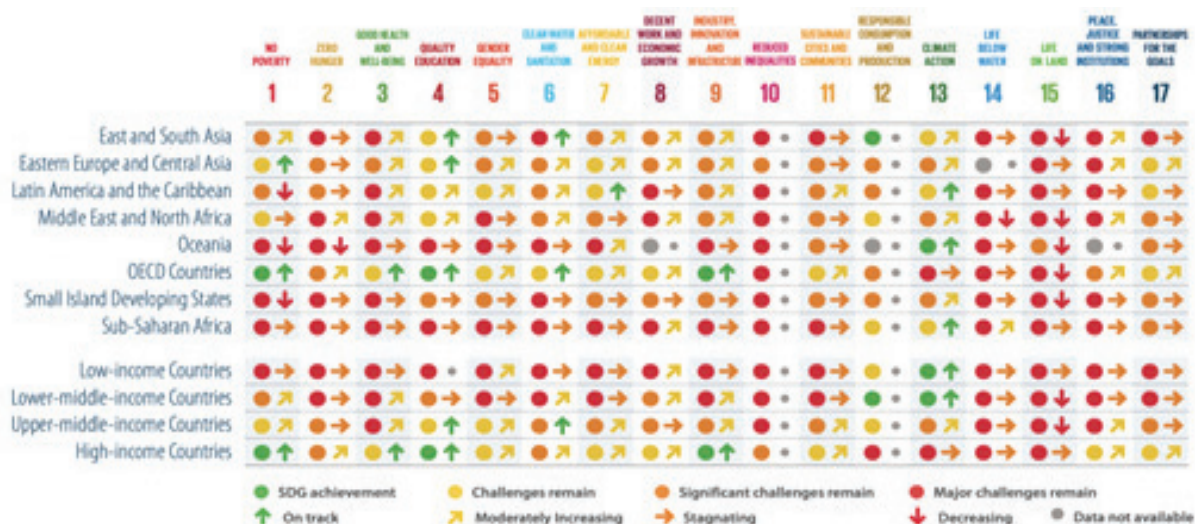
Slika 3. Izvještaj o održivom razvoju 2021. - SDG dashboard (nivoi i trendovi) po regionu i prihodnim grupama

Tipičan primjer vizualizacija može se pronaći u Izvještaju o održivom razvoju 2021. u kojem se predstavlja indeks dostizanja SDG i dashboardi za praćenje dostizanja SDG za sve države članice UN-a. Primjer je prikazan na slici 3 koji omogućava vizuelni prikaz uspješnosti zemalja prema dostizanju ciljeva održivog razvoja. Drugi primjer je prikaz vizualizacije na interaktivnim kartama dat na slici 4.